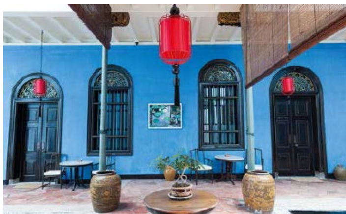
▲ Wewnątrz willi Cheong Fatt Tze

z Państwa Środka, ponieważ przybył na wyspę Penang bez grosza przy duszy, a umierając w 1952 r., pozostawił po sobie finansowe imperium. Dom Yeap Chor Ee 📍 4 Lebuh Penang, www.houseyce.com , pn.–pt. 10.00–18.00, 13 MYR to doskonały przykład dawnej wystawnej architektury kupieckiej. Zorganizowana tu ekspozycja jest poświęcona życiu właściciela i wielu pokoleń migrujących Chińczyków.