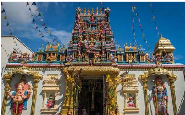
▲ Świątynia hinduistyczna Sri Mahamariamman