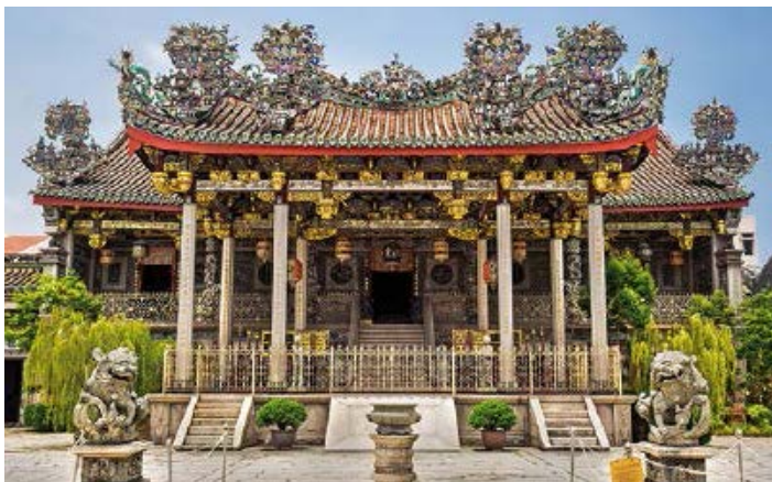
▲ Khoo Kongsi

wystawnych. Był to jeden z pięciu bardziej wpływowych klanów w mieście wywodzących się ze społeczności Hokkien. W XIX w. zabudowania tego typu były swoistym miastem w mieście – w obrębie jednego budynku działały m.in. placówka edukacyjna, finansowa i in. O zamożności rodu Khoo świadczy przepych głównej hali. Niemal każdy jej element ma zdobienia wykonane ze szczególną dbałością o detale, które są dziełem rzemieślników z Państwa Środka. Niezwykłą atmosferę potęgują zwisające z sufitu kolorowe lampiony. Khoo Kongsi to jedna z najchętniej odwiedzanych przez turystów części Georgetown, również ze względu na obecność w pobliżu popularnych murali (zwłaszcza przy Lebuh Armenian, zob. ramka Sztuka z murów , s. 123).